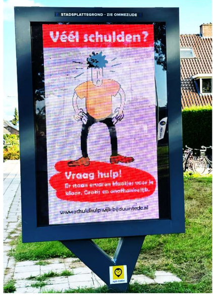
Mini's in 't Groentje (I), Digiborden (b)